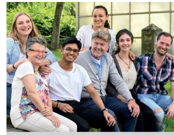
Das machen wir gemeinsam

Der Caritasverband für die Diözese Speyer sammelt am Caritas-Sonntag, 19. September für die Projektarbeit der Caritas-Zentren in Wohnvierteln an den acht Standorten in Germersheim, Kaiserslautern, Landau, Ludwigshafen, Neustadt, Pirmasens, Speyer und Homburg sowie St. Ingbert.