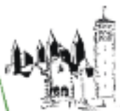
Domgemeinde Mariä Himmelfahrt